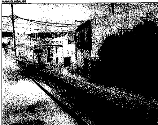
Nucli antic d'Òdena, que serà rehabilitat amb la llei de barris

En canvi, Piera va veure ahir com haurà d'esperar una propera convocatòria anual del Govern per aspirar a rebre els ajuts de la